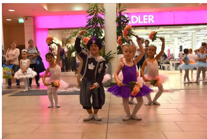
Bild: 10 Rosenarcade Tulln 10Jahre Rosenballett.jpg