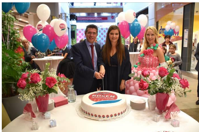
Bild: 01 Rosenarcade Tulln 10Jahre Tortenanschnitt.jpg