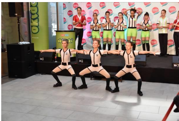
Bilder: 08 Rosenarcade Tulln 10Jahre Rockin Devils.jpg 09 Rosenarcade Tulln 10Jahre Rockin Devils.jpg

Bildtext: Die Rockin Devils begeisterten die Geburtstagsgäste mit einer fulminanten Bühnenshow mitten im Center.