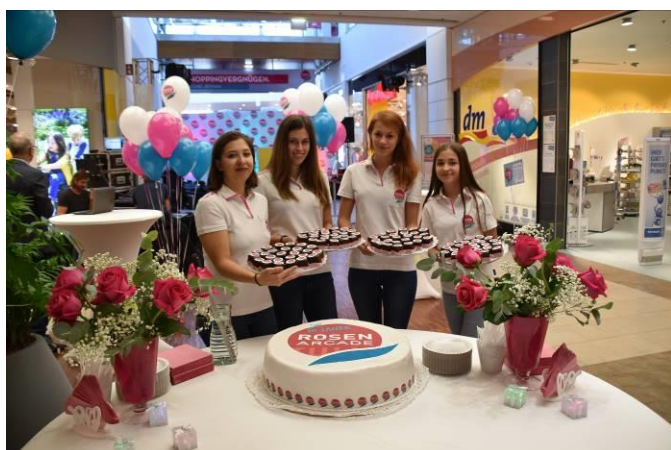
Bild: 02 Rosenarcade Tulln 10Jahre Toertchenverteilung.jpg